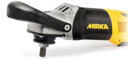
Mirka® PS1437 Poliermaschine, 150 mm