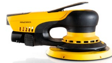
Mirka® DEROS 650CV 150 mm, orbit 5 mm