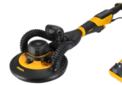
Mirka® LEROS-S 950CV 225 mm, orbit 5 mm