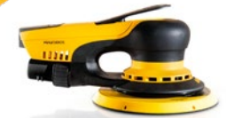
Mirka® DEROS 650/680CV 150 mm, orbit 5/8 mm