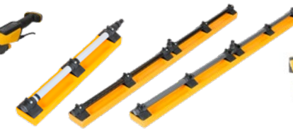
Mirka® Lang Schleifbretter 115 x 680 mm / 115 x 1600 mm (Steif & Flexibel)